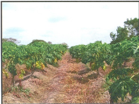
Siembra de Lechozas