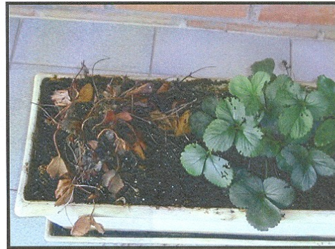
Plantas de fresa inoculadas con el patógeno, a la izquierda sin protección, a la derecha planta protegida con el biocontrolador